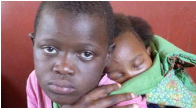
Ältere Schwester als Mutterersatz