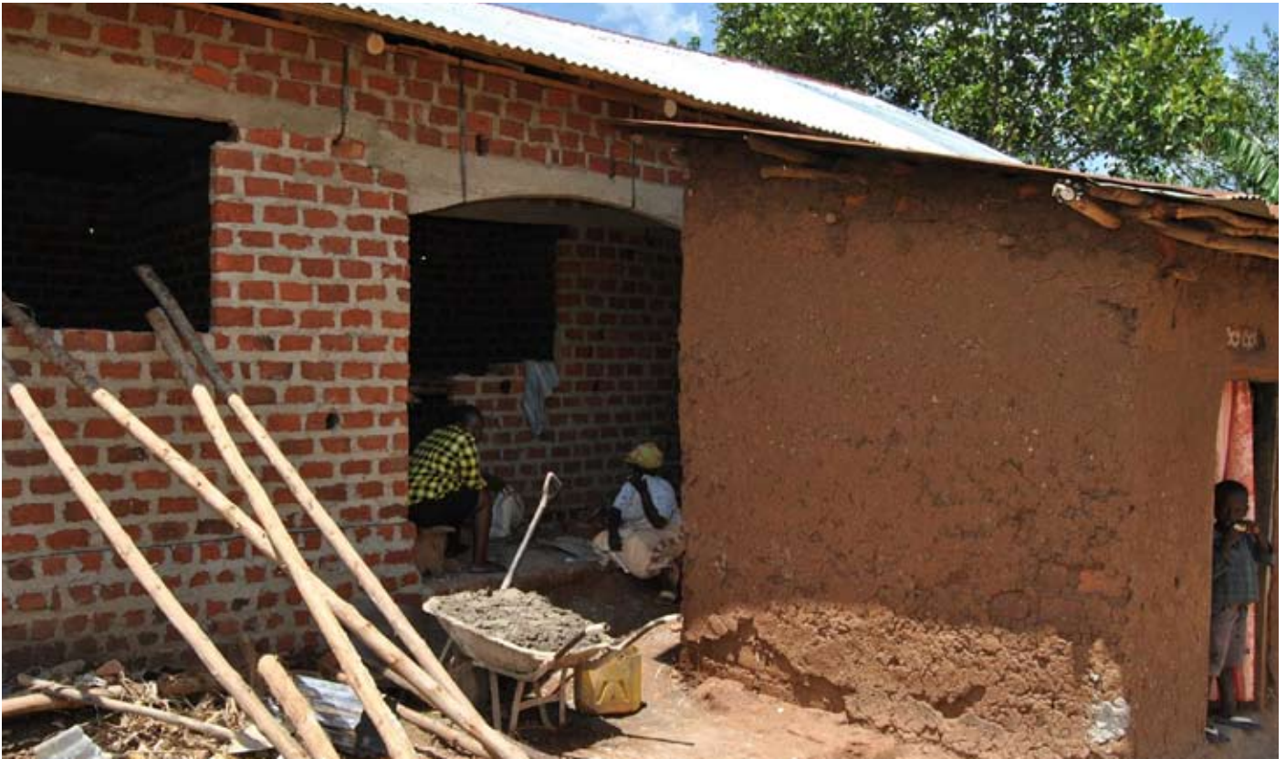
Endlich ein Wohnsitz in Massivbauweise für eine mittellose, neunköpfige Familie